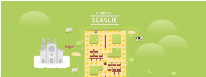
Parmigiano Reggiano Lancia "Il Gioco Di Scaglie" Per Imparare, Divertirsi E Fare Beneficenza