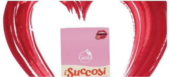
Le Arance Di GIOIA Sostengono La Ricerca Di Fondazione IEO-MONZINO